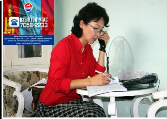
/Боловсролын газрын дарга/