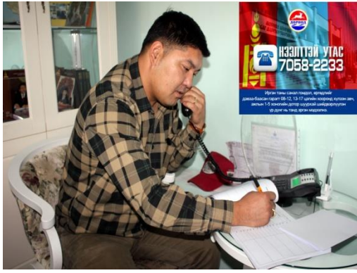
хөгжил ОНӨҮГ-н дарга/