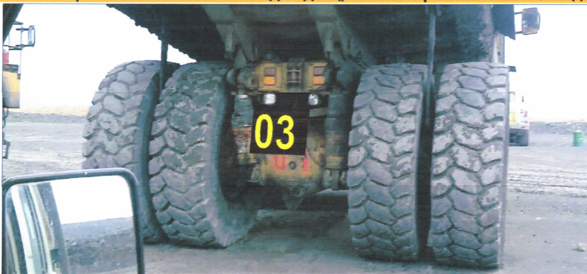
Зураг №6. Арын дугаарыг 2-р стандартаар хийж резин эсхүл метал суурин дээр байрлуулна.