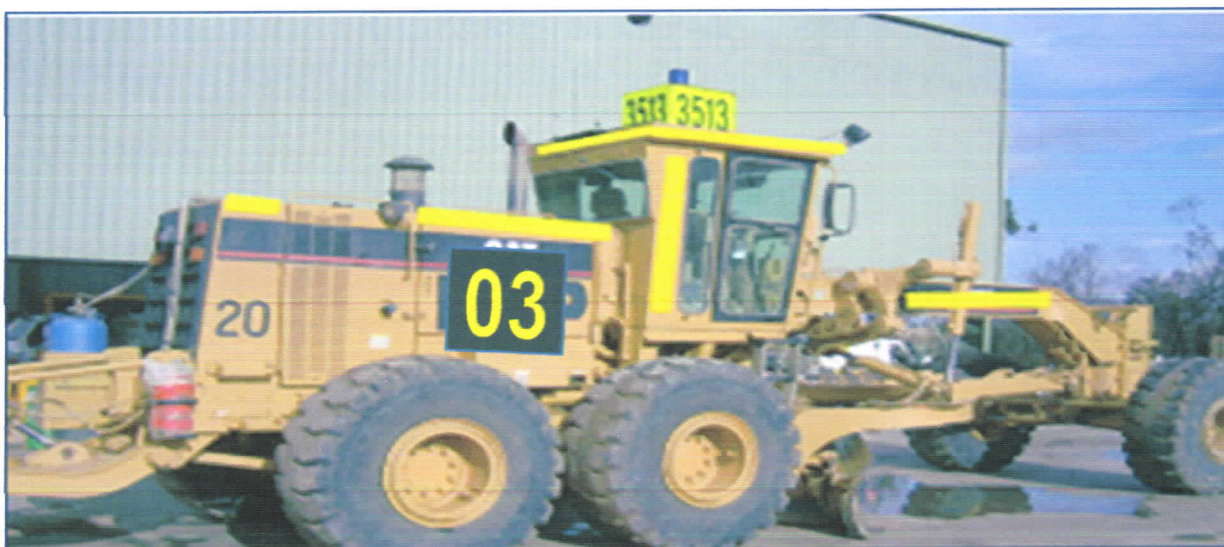
Зураг №8. Грейдер болон дугуйт ачигчийн орой дээр хийсэн 3-н талт номерыг харуулав.