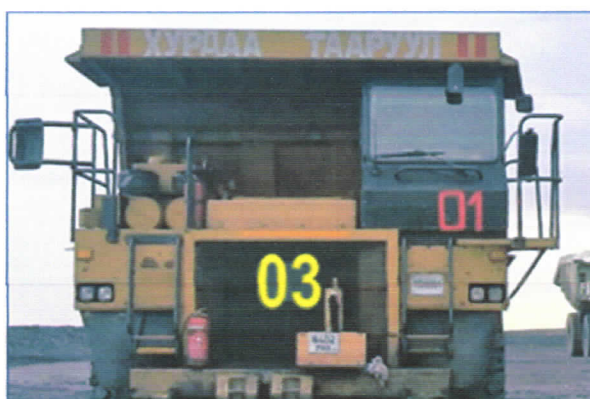
Зураг №7. Урд болон хажуугийн дугаарыг 3-р стандартаар хийж МТ4400-ийн адил байрлуулна.