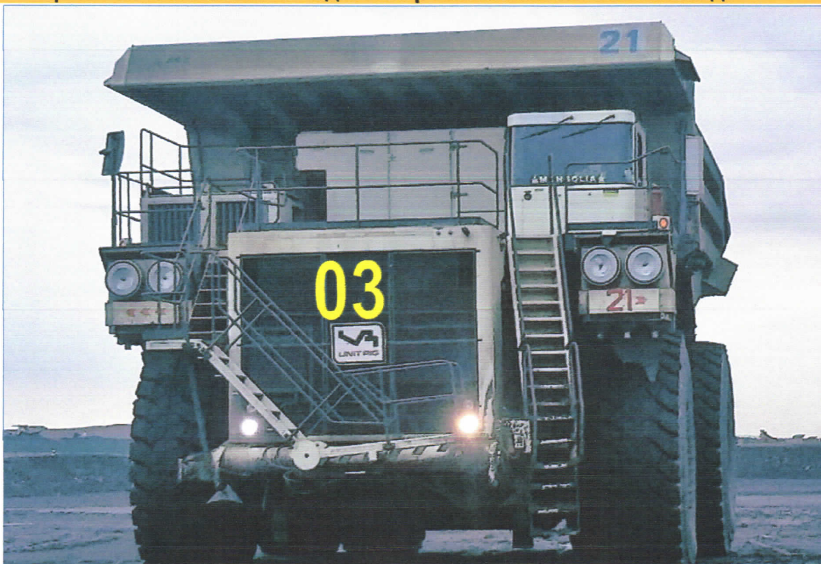
Зураг №3. Урд талд нүүрэн дээр 4-р стандартаар хийнэ.