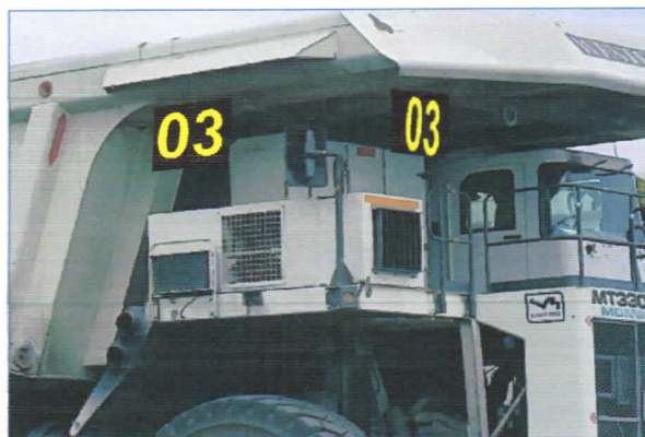
Зураг №4, 5. Дээрээс болон шатанд зүүх 2 байрлал байна. 3-р стандартаар хийнэ.