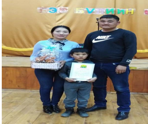
ТАЙЛАН БИЧСЭН: ЗАН