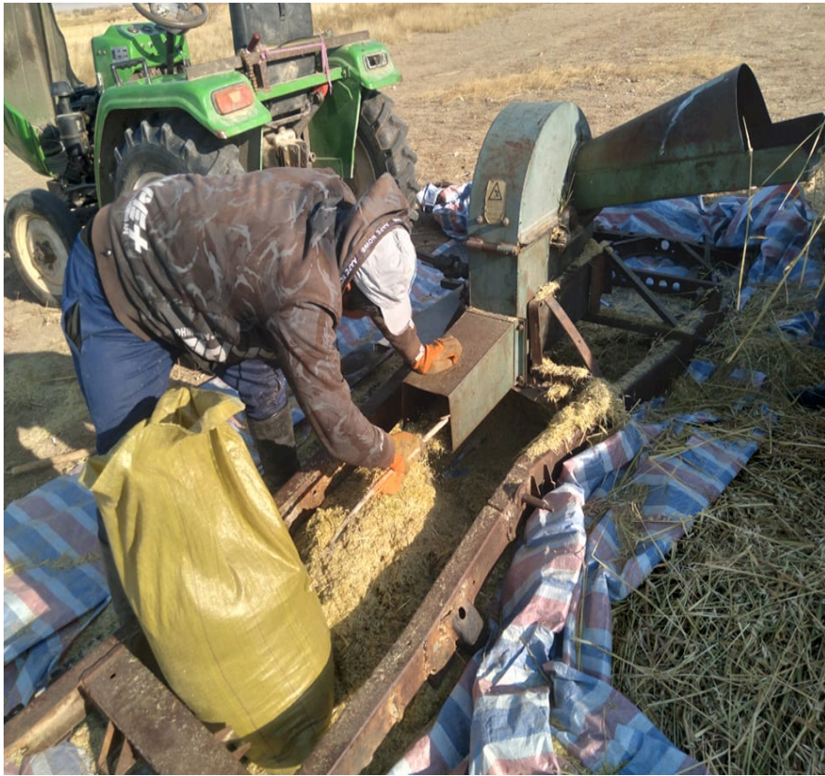
ТАЙЛАН БИЧСЭН ТББ-ЫН ТЭРГҮҮН