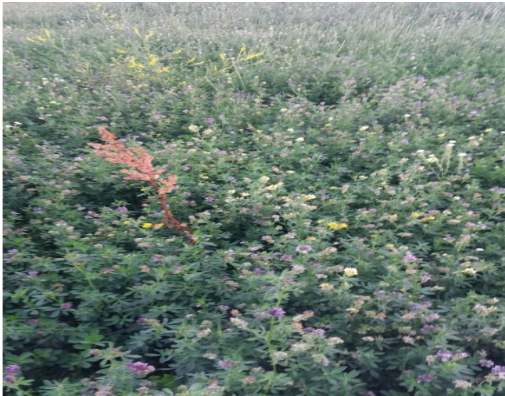
ХЭРЭГЖҮҮЛСЭН ХУГАЦАА: 2019.05-12 САР