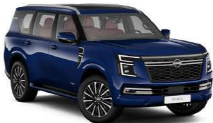
Grand Blue (RCJ)