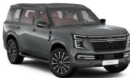
Gray Metallic (KAD)