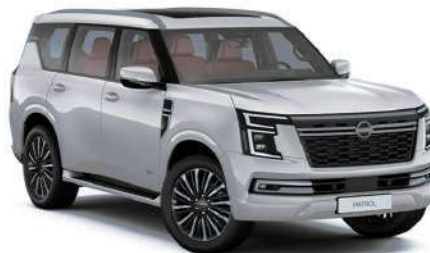
Silver Metallic (K23)