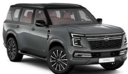
Gray Metallic with Super Black Roof (GAQ)