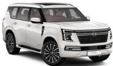
Pearl White (QAC)