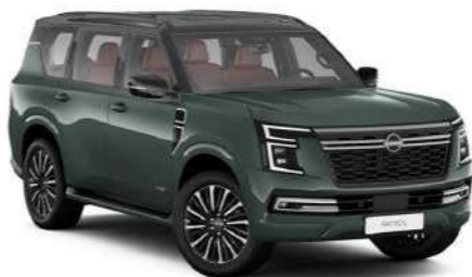
Forest Green (DAR)