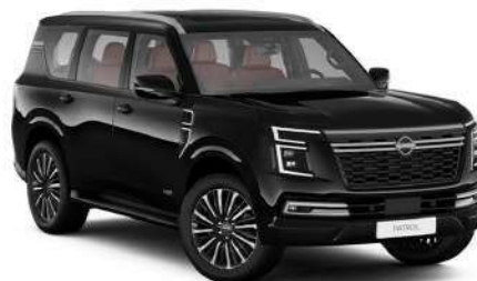
Mineral Black (GAT)