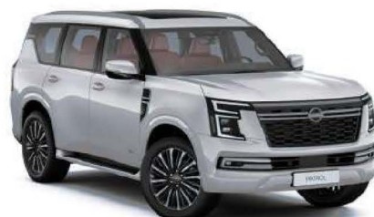
Silver Metallic (K23)