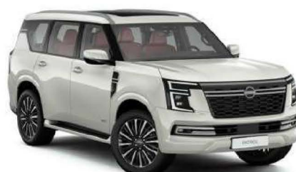
Radiant White (QBE)