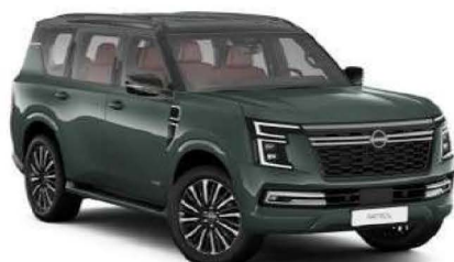
Forest Green (DAR)