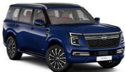
Grand Blue (RCJ)