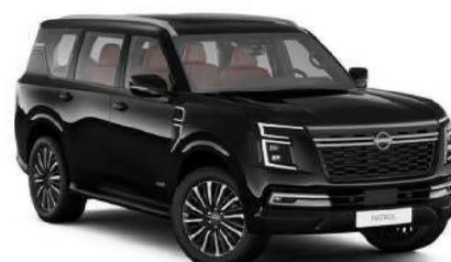
Mineral Black (GAT)