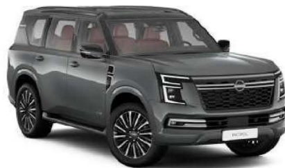
Gray Metallic (KAD)