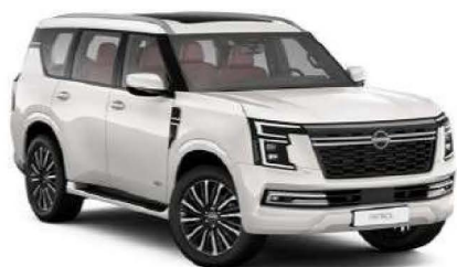
Pearl White (QAC)