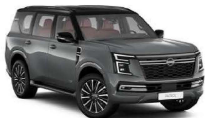
Gray Metallic with Super Black Roof (GAQ)