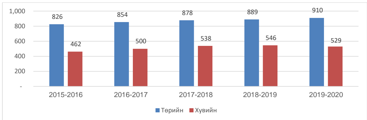
График 1. Сургуулийн өмнөх боловсролын байгууллага (он, өмчийн хэлбэрээр)

Сүүлийн 5 жилийн байдлаар нийт цэцэрлэгийн жилийн дундаж өсөлт 2.1, төрийн өмчийн цэцэрлэгийн жилийн дундаж өсөлт 1.8, хувийн цэцэрлэгийн жилийн дундаж өсөлт 2.5 хувьтай байна.