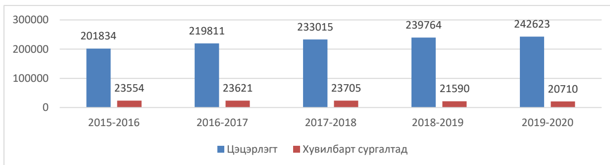
График 3. СӨБ-д хамрагдагчид (Сургалтын хэлбэр, оноор)

Цэцэрлэгийн үндсэн сургалтад хамрагдаж байгаа хүүхдийг бүлгээр нь авч үзвэл: бага бүлэгт 45,372 буюу 18.7 хувь, дунд бүлэгт 55,672 буюу 22.9 хувь, ахлах бүлэгт 65,414 буюу 27.0 хувь, бэлтгэл бүлэгт 70,847 буюу 29.2 хувь, холимог бүлэгт 5,3182 буюу 2.2 хувь нь хамрагдаж байна.