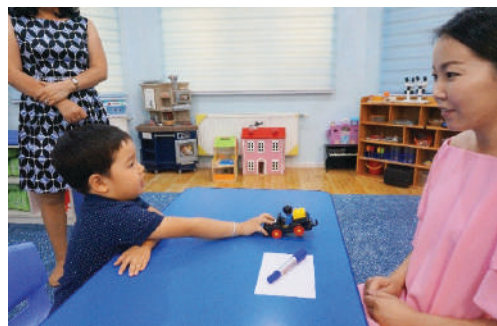
Хүүхэд аль нэгд нь хүрч сонгоход магтан, түүгээр тоглуулах