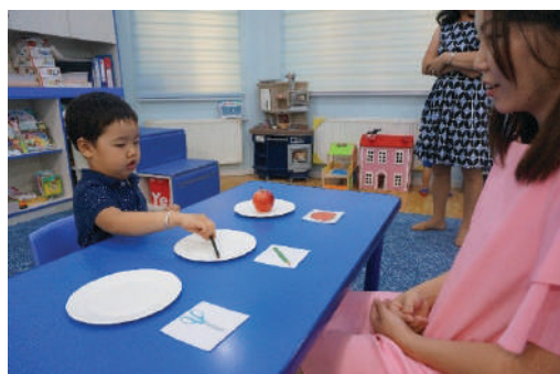
Хүүхэд авсан зүйлээ ижил зурагтай тавганд хийх