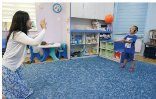
Багш жижиг бөмбөг хүүхэд уруу шидэх