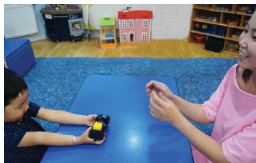
Хүүхэд зөв хэлж, тодорхой үйлдэл гаргасан тохиолдолд хүссэн зүйлийг нь өгөх