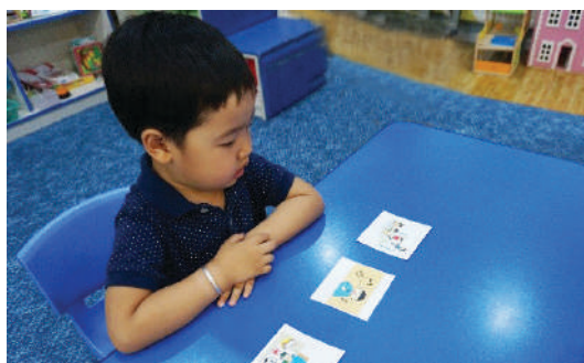
Багш зураг будаж байгаа, дуу дуулж байгаа үйл хөдлөлтэй зурагт карт тавих