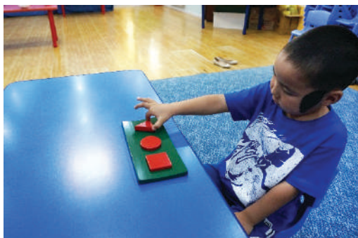
Хэвэнд гурвалжин дүрсийг хийх