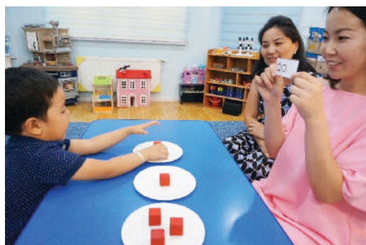
Ширээн дээр тус бүр 1,2,3 ширхэг шоотой таваг тавина. Багш дугуй дүрс зурсан картыг үзүүлэн картан дээр байгаа дугуй дүрсийн тоотой ижил тавагтай шоог олуулах