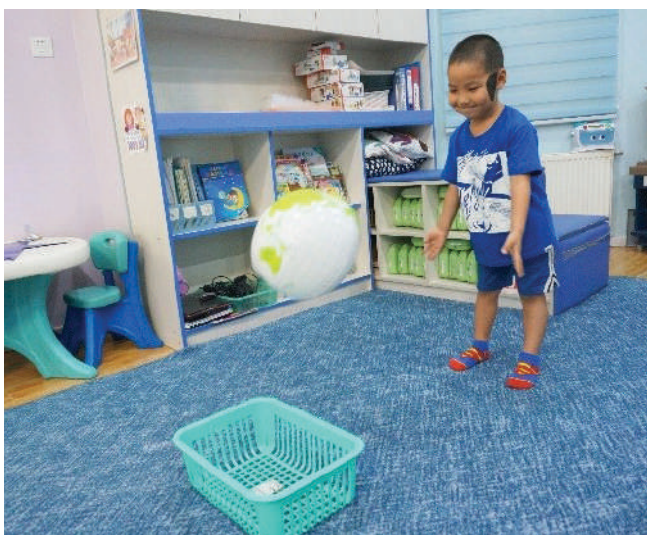
Бөмбөгөө шидэж оруулах