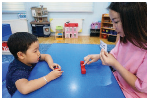
Хүүхэд хэлсэн тооны шоог багшид авч өгнө. "3 дугуй дүрстэй карт болон шооны тоо ижил байна" гэдгийг баталгаажуулж, сайн гүйцэтгэсэн бол магтана.