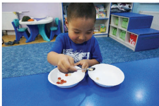
Халбагаар эд зүйлийг нэг тавагнаас нөгөө таваг уруу хийх