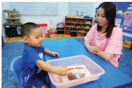
Сургалтын хэрэглэгдэхүүнийг хэрэглэж дууссаны дараа сагсанд хийх