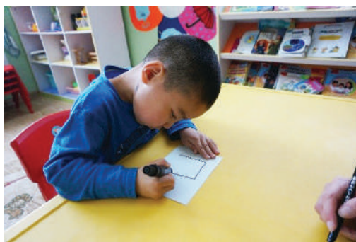
Хүүхэд эсгий балаар давхарлаж зурах