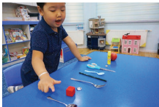
Багш 10 өөр төрлийн зүйлийг тавина. Хүүхэд нэг нэгээр нь хуруугаараа заан тоолно.