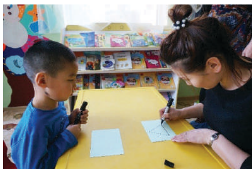
Гурвалжин дүрс зурж үзүүлэх