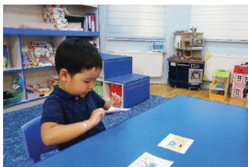
Хүүхэд түүнээс дуртайгаа сонгох