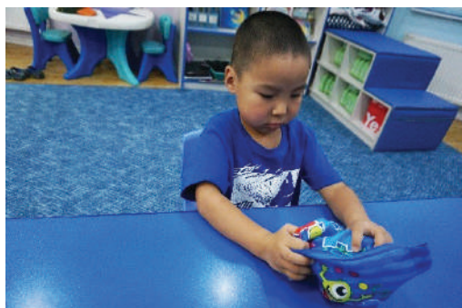
Уутанд юу байгааг тэмтэрч мэдрэх