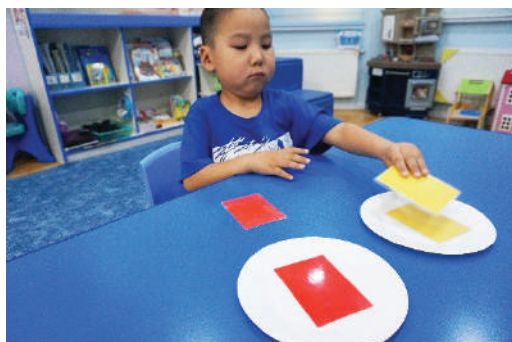
Ижил өнгийг тааруулж тавган дээр тавих