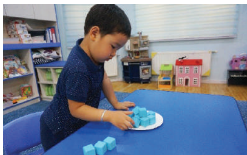
Хүүхэд багшийн хэлсэн дагуу шоог тавган дээр тавина. Зөв тавьж чадвал 10 дугуй дүрс бүхий карт үзүүлэн ижил байгааг баталгаажуулна.