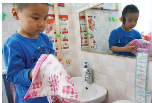
Өөрөө гараа арчих