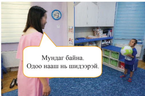
Хүүхэд барьж авсан бөмбөгөө багш руу буцааж шидэхийг хүсэх