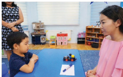
Багш 2 зүйл зэрэгцүүлэн тавьж аль нэгийг нь сонгуулах