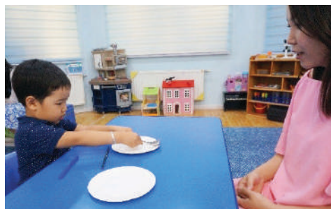
Багш ширээн дээр ижил зориулалттай зүйлс тавих /халбага сэрээ, бал харандаа/