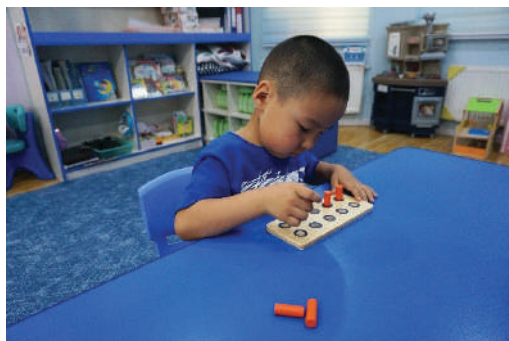
Хүүхэд “Пэг” тоглоомын сууринаас дүрсээ гаргах