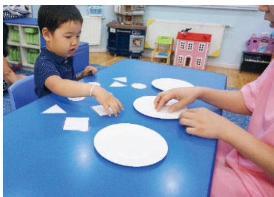
3 тавагны гадна дүрсүүдээ эмх замбараагүй тавина. /тавганд юу ч хийхгүй/