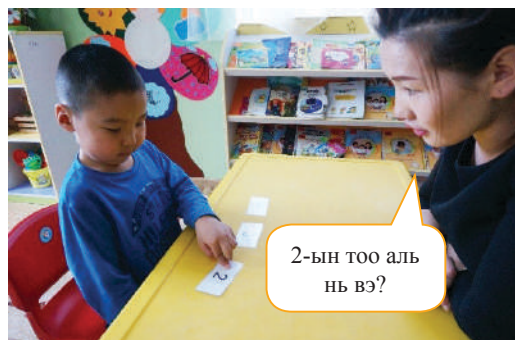
Багш “..... аль нь вэ?” гэж асуун, тэрхүү тоотой картыг олохыг хүсэх