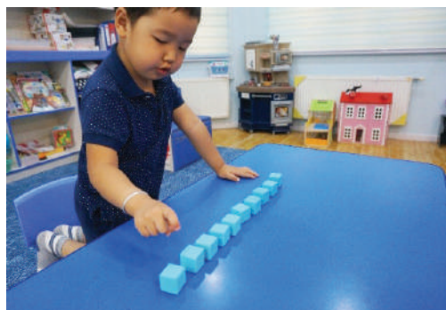
Багш 10 ширхэг шоо өрнө. Хүүхэд нэг бүрчлэн хуруугаар заан тоолох