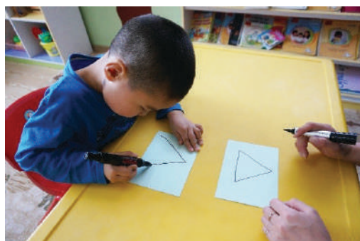
Хүүхэд багшийн адилаар гурвалжин дүрс зурах