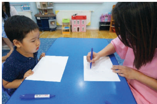
Багш дугуй дүрс зурж үзүүлэх