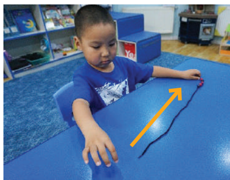
Сүвлэсэн шүрийг уяанаас гаргах