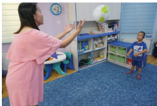
Багш бөмбөг шидэхэд хүүхэд барьж авах