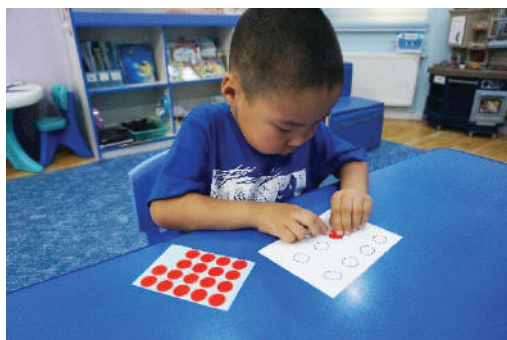
Том наалтыг хүрээн дотор наах