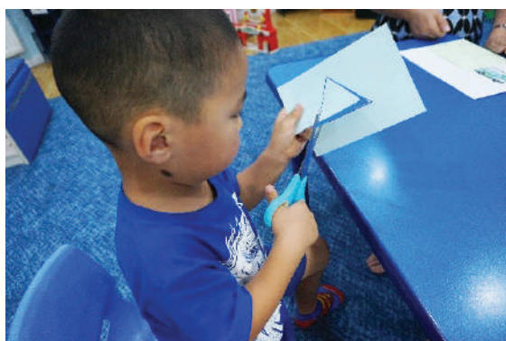
Зураасны дагуу гурвалжин дүрсийг хайчлах