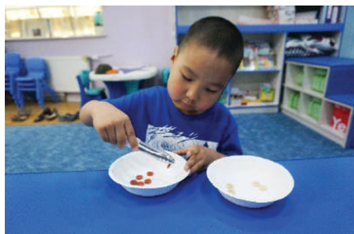
Хавчаараар хавчин эд зүйлсийг нэг тавагнаас нөгөө таваг уруу хийх