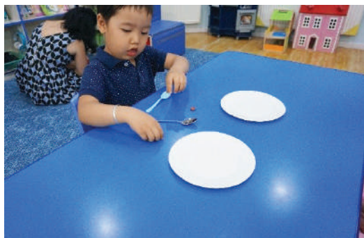
2 тавагны гадна халбага, харандаа хэд хэдийг эмх замбараагүй тавих