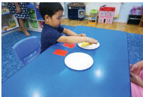
Картуудыг ижил өнгөөр ялгаж тавих