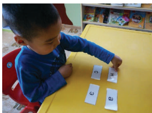
Хүүхдийн нэрэнд орсон үсгийг үзүүлэн ижил үсгийг олуулах