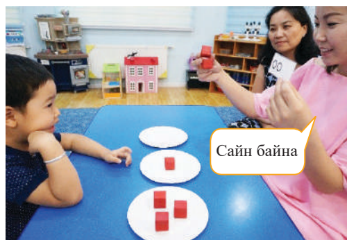
Зөв сонгож чадвал картан дээрх дүрс болон шооны тоог харьцуулж хэлүүлэн адил тоотой байгааг баталгаажуулах