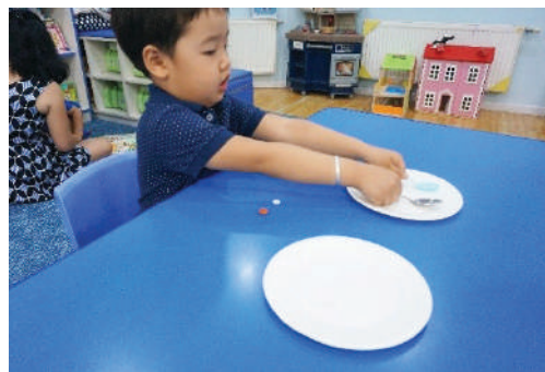
Ижил ижлээр нь нэг тавганд хийлгэх