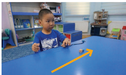
Багшийн хийснийг хүүхэд дуурайж хийх