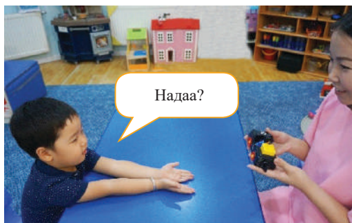
Хүүхэд хүсэж буй зүйлээ авах үед "Надаа" гэдэг дохио өгөх