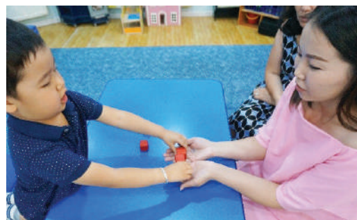
Хүүхэд картан дээр зурсан дугуй дүрстэй адил тооны шоог авч өгөх