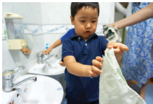
Алчуур өгөхөд гараа арчих