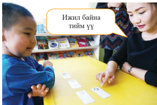
Багш 1 цагирагтай ижил картыг үзүүлж ижил байгааг баталгаажуулах