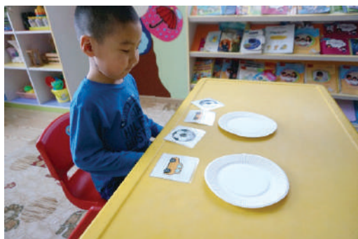
Багш магтангаа дүрсийг харуулж "Ижил байна, тийм үү" гэж нягтлах