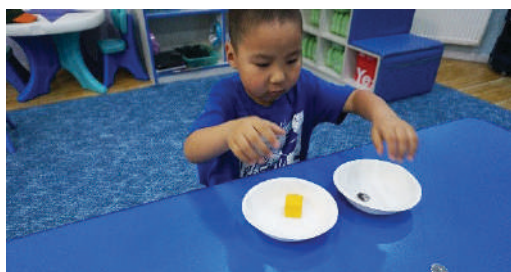
Таваг дээр 1,1 ялгаатай зүйл тавина. Нөгөө ижлийг нь тавагны гадна сул тавих