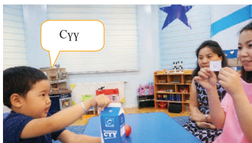
Олж чадвал үгийн дуудлагыг давтан хэлнэ