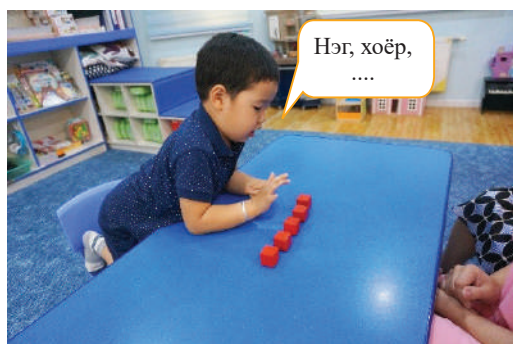
Багш ширээн дээр 5 ширхэг шоо тавина. Хүүхэд шоог хуруугаар зааж, чангаар тоолох