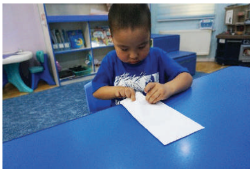
Нугалсан цаасаа дугтуйд хийх