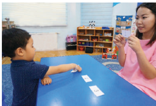
Багш ширээн дээр тоотой карт тавина. Түүнтэй ижил картыг олохыг хүүхдээс хүсэх