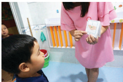
Гар угаах дарааллыг тайлбарлах