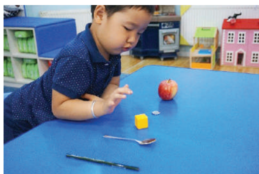
Багш ширээн дээр 5 өөр төрлийн зүйлийг тавина. Хүүхэд хуруугаар зааж, чангаар тоолох