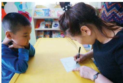
Багш нарийн үзүүртэй балаар дөрвөлжин дүрс зурж үзүүлэх