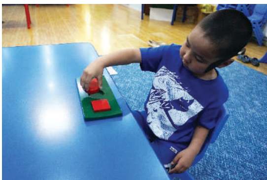
Хэвэнд дугуй дүрсийг хийх