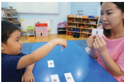
Багш хүүхдийн нэрэнд орсон үсэг бичсэн картыг харуулж, ижил үсэгтэй картыг олуулах