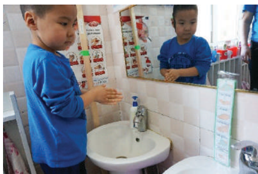
Гар угаах зурагт картыг харангаа гараа угаах