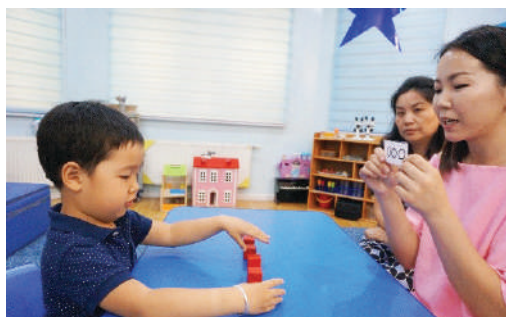
Багш 5 ширхэг шоо эгнүүлж тавин, 1-5 дугуй дүрс зурсан картыг үзүүлэх