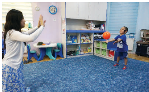
Хүүхэд бөмбөгийг барьж авах