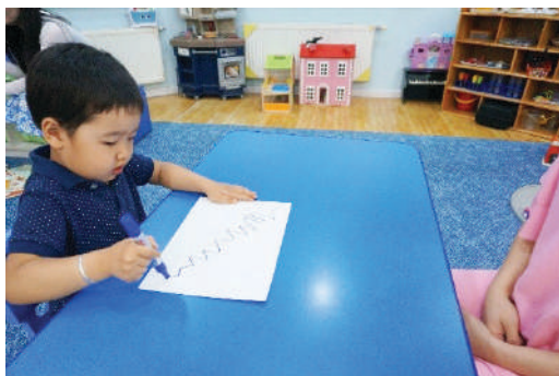
Хүүхэд өөрийн дураар сараачих