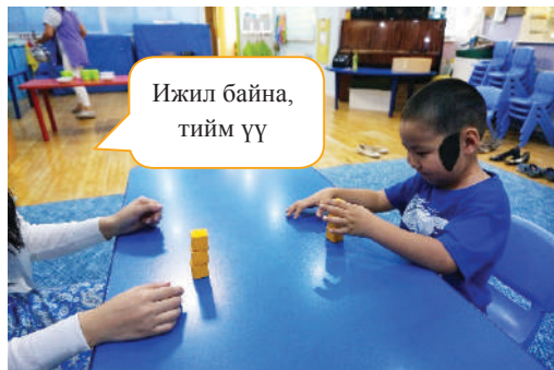
Хүүхэд багшийг дуурайж өрөх