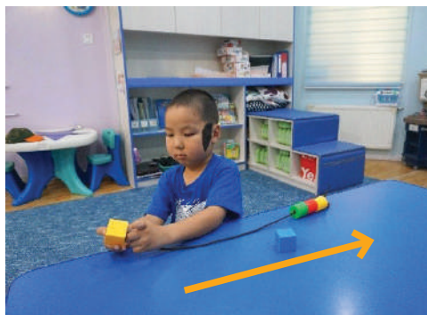
Хүүхэд даган дуурайж хийх