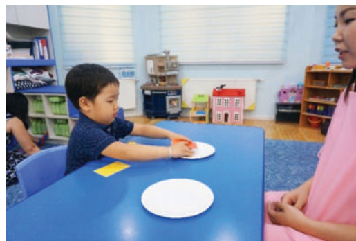
Өнгөөр ижилсүүлж тавих /шоо болон өнгийн карт/