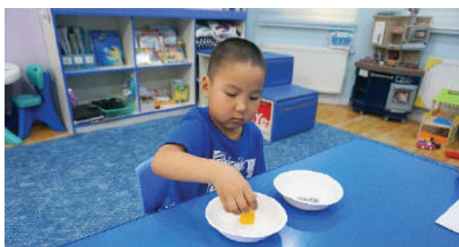
Хүүхэд тавганд ижилсүүлэн ялгаж хийх