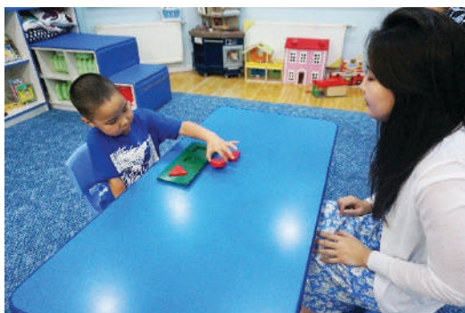
Хэвнээс дугуй дүрсийг гаргах