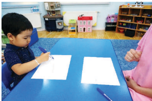
Хүүхэд дуурайж зурах