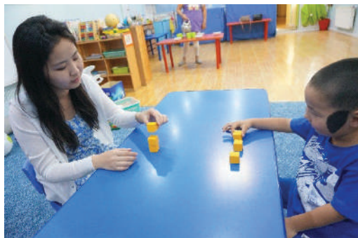
Багш шоо өрж байгааг хүүхэд ажиглах