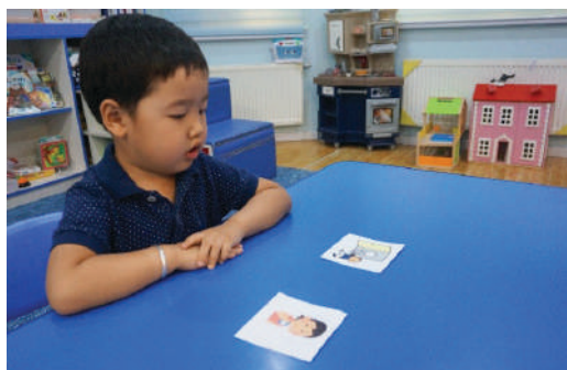
Багш “Юм уух”, “Ариун цэврийн өрөө явах” гэх мэт зурагт картыг эгнүүлж тавих