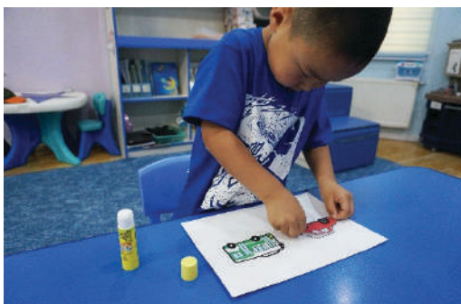
Цавуудсан дүрсээ хүрээнд наах