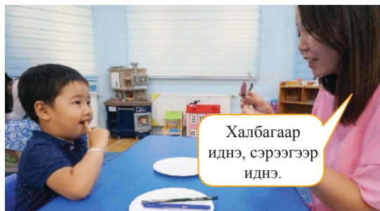
“Ижил ижлээр нь тавганд хийгээрэй” гэж хэлээд чадвал магтаад “Халбагаар иднэ, сэрээгээр иднэ”, “харандаагаар бичнэ, балаар бичнэ” зэргээр зөв хийж байгааг тайлбарлах