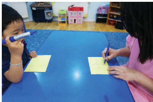
Багш нэмэх тэмдэг зурж үзүүлэх