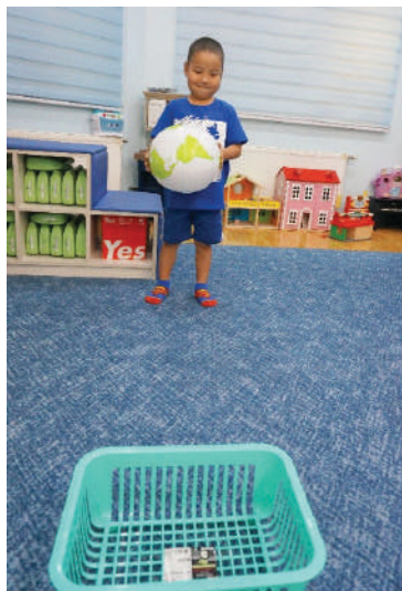
Сагсыг бага багаар холдуулах