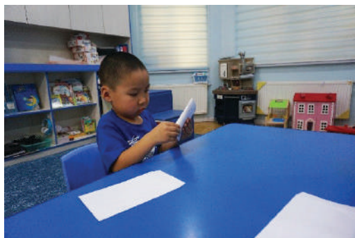
Хүүхэд цаасыг дундуур нь нугалах