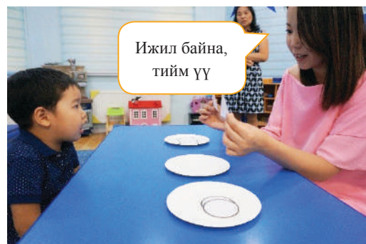
Багш магтангаа дүрсийг харуулж “Ижил байна, тийм үү” гэж нягтлах