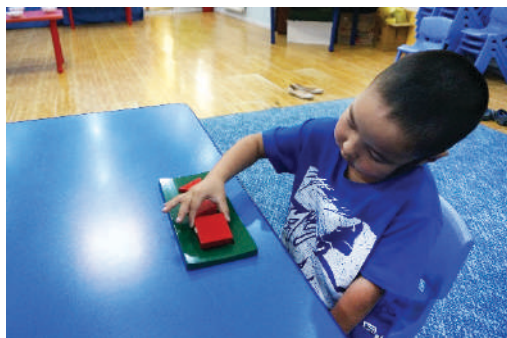
Хэвэнд дөрвөлжин дүрсийг хийх