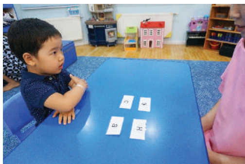
Багш өөр өөр үсэг бичсэн картыг зэрэгцүүлж тавих