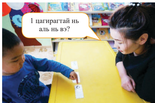
Хүүхдээр 1 цагирагтай картыг сонгуулах