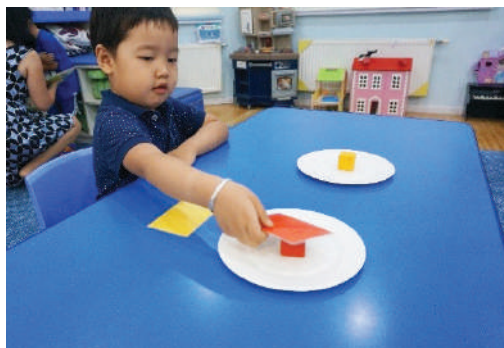
2 тавагт өөр өнгөтэй ижил зүйл нэг нэгийг тавина. Хосыг нь тавагны гадна тавих