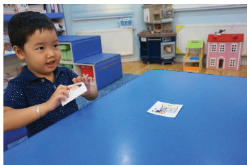
Хүүхдээс саналыг асуун сонгуулна. Өөрийн хэрэгцээг илэрхийлж чадаж байвал тэрхүү үйл хөдлөлийг нь хийлгэх /юм ууж байгаа карт сонгосон тул уух юм өгнө/