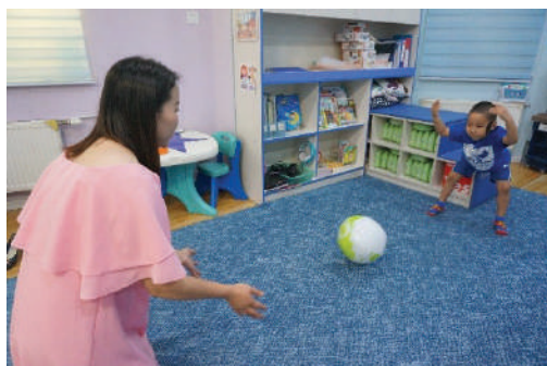
Том бөмбөгийг өнхрүүлэх