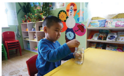
Хүүхэд гаргаж авсан юмаа буцааж саванд хийх. Хийж чадвал магтах