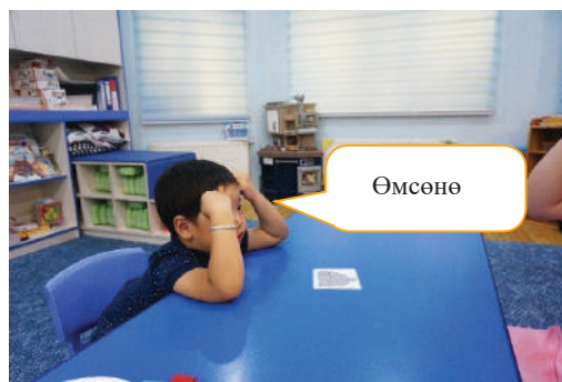
Хүүхэд “Өмсөнө” гэж хариулах