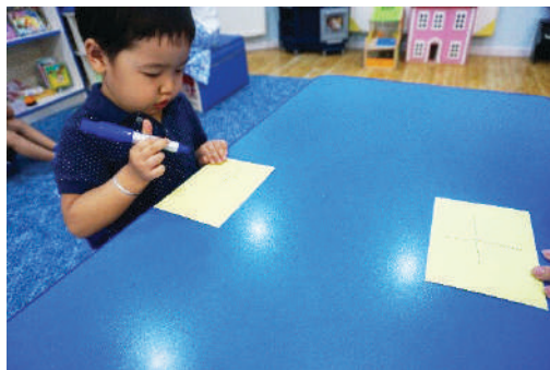
Хүүхэд дуурайж нэмэх тэмдэг зурах