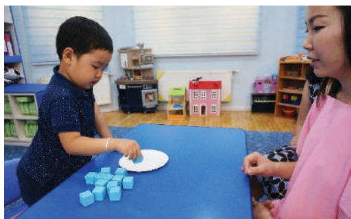
Багш ширээн дээр 13 ширхэг шоог замбараагүй тавина. Тавган дээр 10 ширхэг шоо тавиарай гэж хүүхдэд хэлнэ.