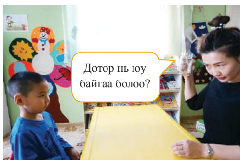
Багш савыг сэгсэрч юм байгааг анхааруулж хамтдаа гаргаж авах