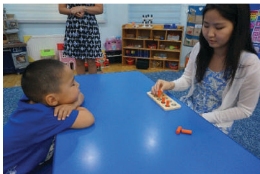
“Пэг” тоглоомын сууринд дүрсийг хийж үзүүлэх