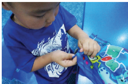
Уутны товчийг нь тайлж, доторх зүйлийг гаргах