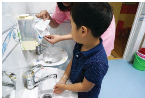
Зааврыг харж гараа угаах