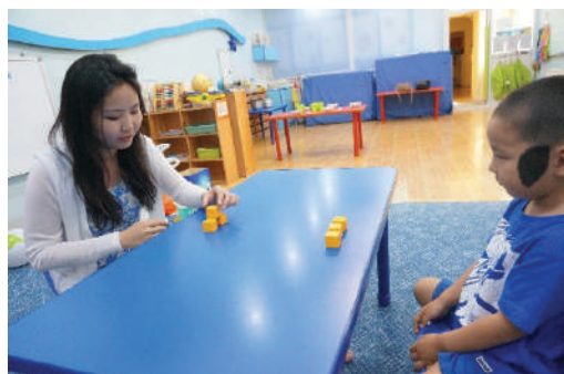
Багш хэрхэн шоо өрж байгааг хүүхэд ажиглах