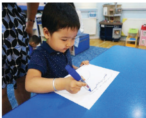
Хүүхэд дуурайж зурах