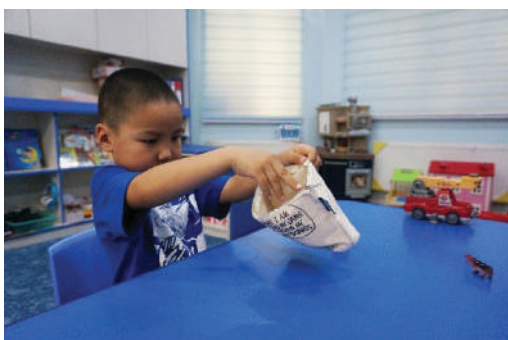
Уутанд эд юмсыг буцаан хийж, цахилгааныг татах