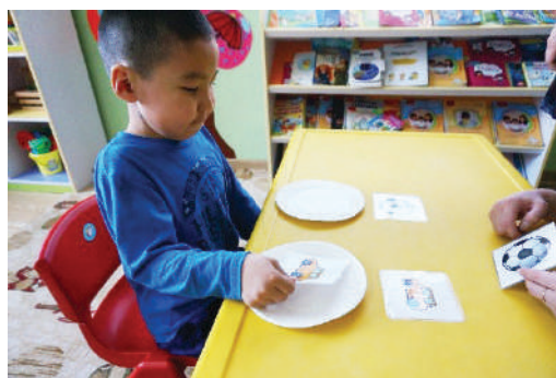
Хүүхдээр ижлийг нь олуулж тавганд ялгаж тавиулах