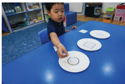
Таваг дээр тавьсан дүрсүүдийн ижлийг олуулах