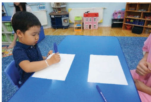
Хүүхэд багшийг дуурайж дугуй дүрс зурах