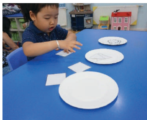
Хүүхэд ижил дүрсүүдийг олж, хос хосоор нь тавганд хийнэ. Хийж чадвал магтана.