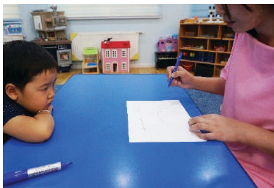
Багш муруй, шулуун шугам зурж үзүүлэх