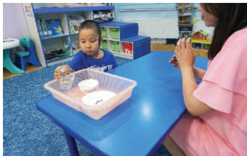
Хооллосны дараа аяга тавгаа хураах