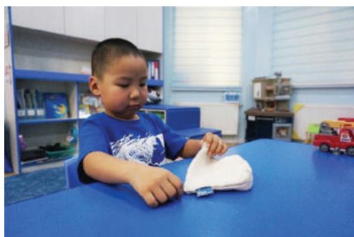
Уутны цахилгааныг нээж, доторх эд юмсыг гаргах