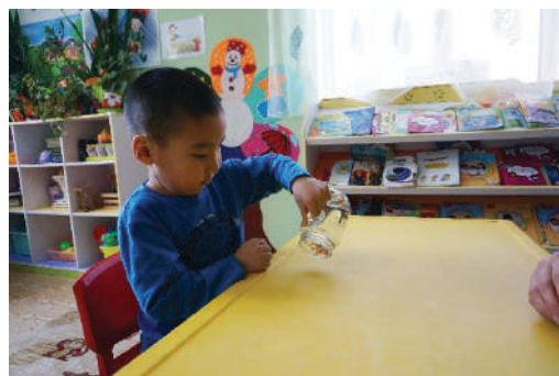
Хүүхэд савнаас эд зүйлийг гаргаж авах