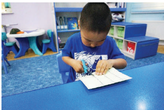
Цаасыг зураасны дагуу хайчлах