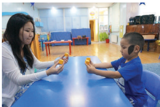
Багш, хүүхэд аль аль нь хоёр гартаа нэг нэг модон шоо барих