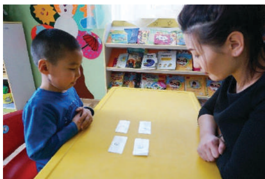
Багш ширээн дээр өөр өөр үсэгтэй хэд хэдэн карт тавих