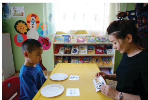
Тавганд 1,1 ялгаатай зурагт карт тавина. Нөгөө ижлийг нь тавагны гадна тавих