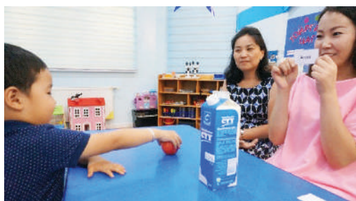
Багш ширээн дээр бодит зүйл тавина. /алим, сүү/ Тэдгээрийг бичсэн карт үзүүлэн адил картыг олуулах