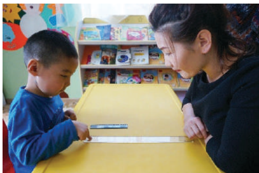
Багш урт, богино 2 шугам зэрэгцүүлж тавин “Аль нь урт вэ?” гэж хүүхдээс асуух