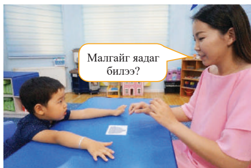
Багш малгайны зурагт карт тавин, “Малгайг яадаг билээ?” гэж асуух