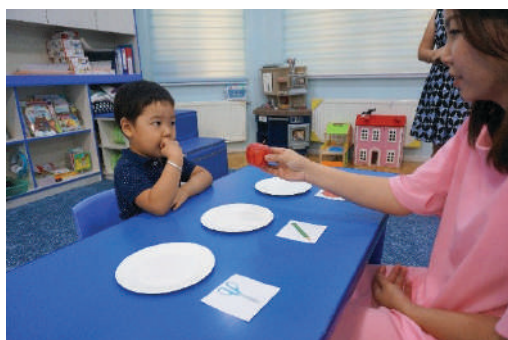
Багш зургийг тавагны урд тавьж, бодит зүйлийг хүүхдэд өгөх