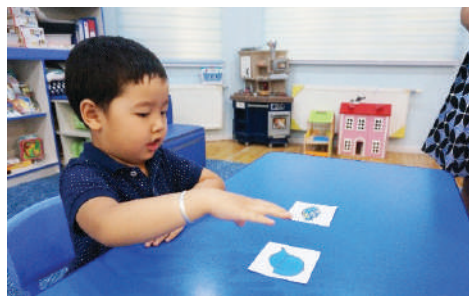
Багш “Малгай” ба “Гутал”-ны зурагт карт зэрэгцүүлж тавих