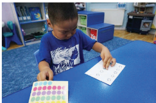
Жижиг наалтыг хүрээн дотор наах