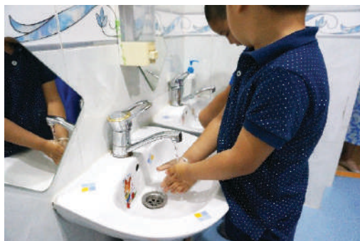
Гоожиж буй усанд гараа норгох