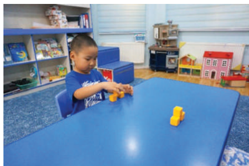
Багшийг дуурайж хүүхэд шоог өрөх