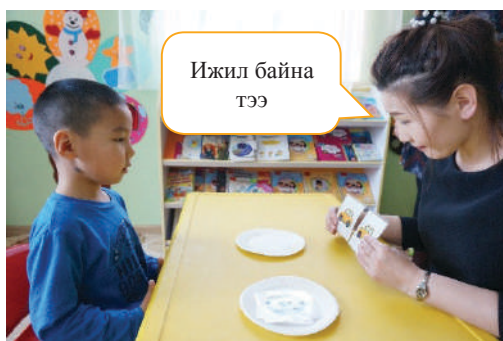
Хүүхэд ижил дүрсийг нэг тавганд хийх /ангилах арга/