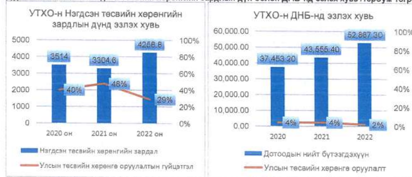
Дүрслэл 2: УТХО-н Нэгдсэн төсвийн хөрөнгийн зардлын дүн болон ДНБ-нд эзлэх хувь /тэрбум төгрөг/