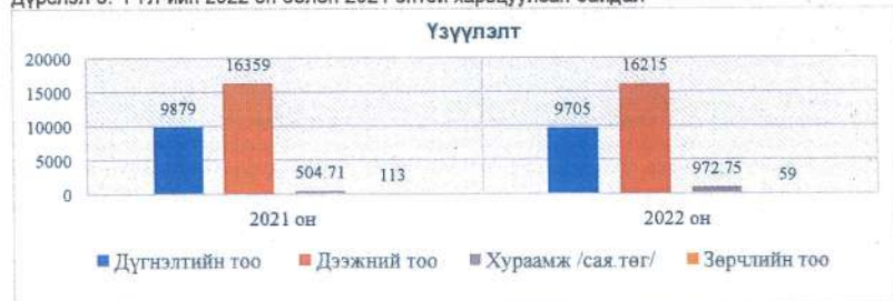
Дүрслэл 3: ГТЛ-ийн 2022 он болон 2021 онтой харьцуулсан байдал

2.15. СаС-ын багцын Гаалийн шинэчлэлийн хүрээнд улсын төсвийн хөрөнгө оруулалтаар гаалийн төв болон салбар лабораториудад АНУ, Герман, Англи, Япон, Швейцари, Итали, Австри, БНХАУ зэрэг орнуудад үйлдвэрлэгдсэн, олон улсад танигдсан Agilent, Thermo scientific, Tanaka, Koehler, Anton Paar, SKIC, Mesdan, Leco, Borgwaldt, Bruker зэрэг брэндийн эрдэс түүхий эд, нүүрс, газрын тосны бүтээгдэхүүн, химийн болон мансууруулах, сэтгэгдэл нөлөөт бодис, согтууруулах ундаа, тамхи, тамхины бүтээгдэхүүн, ноос ноолуур, малын гаралтай ширхэгт материал, эрүүл ахуй, хорио цээр (2022.01.01-ээс хилийн мэргэжлийн хяналтын байгууллага гаалийн байгууллагатай нэгдсэн)-ийн шинжилгээний чиглэлээр орчин үеийн өндөр бүтээмжит, автомат, дэвшилтэт технологид суурилсан тоног төхөөрөмжүүд нийлүүлэгдсэн байна. Үр дүнг дүрслэлээр харуулбал: