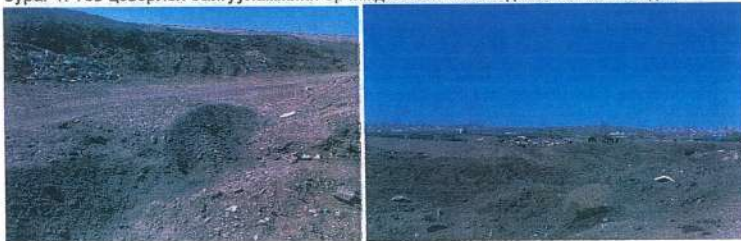
ДЦС 4-ийн үнс