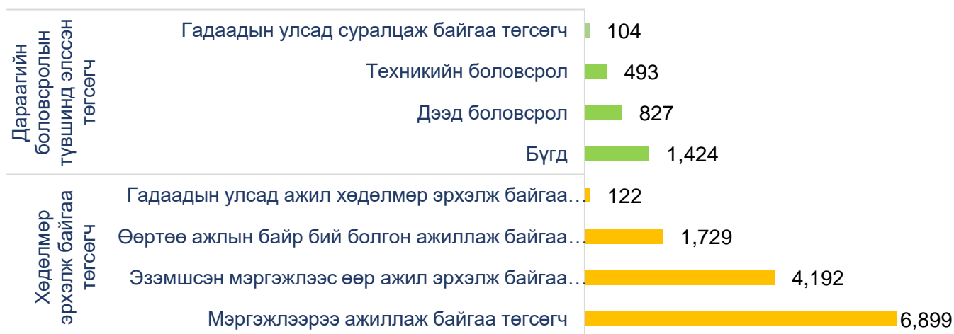
Зураг 2. 2020-2021 оны хичээлийн жилийн төгсөгчөөс ажил, хөдөлмөр эрхэлж байгаа болон дараагийн боловсролын түвшинд элссэн төгсөгч