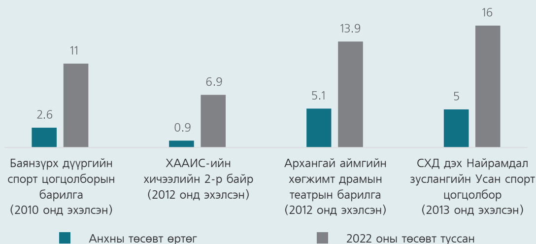
График 1. Дуусаагүй зарим барилгын үнийн өсөлт (тэрбум төгрөгөөр)