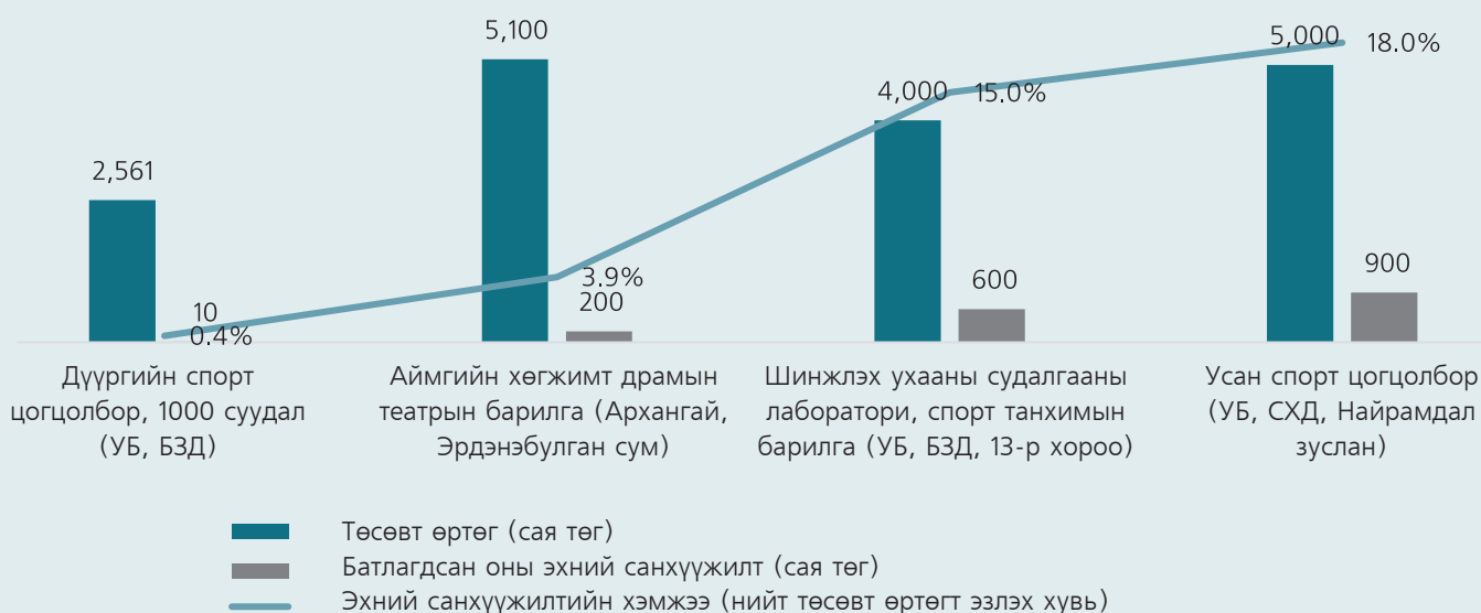
График 2. Он дамжсан зарим барилгын эхний санхүүжилт төлөвлөгдсөн байдал