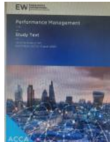
ACCA Performance Management Study Text

Хэвлэсэн: 2021, Хэл: Англи ISBN: ISBN: 978-1-84843-970-2