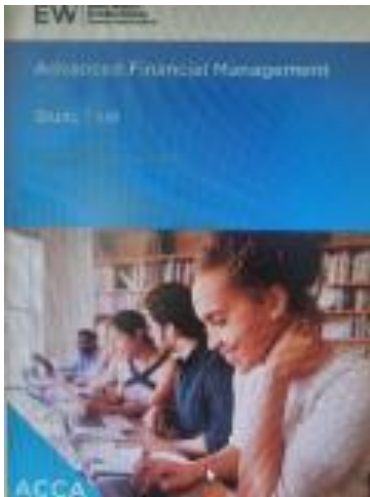
ACCA Advanced Financial Management Study Text

Хэвлэсэн: 2022, Хэл: Англи, Хуудас: 615 ISBN: ISBN: 978-1-84843-596-4