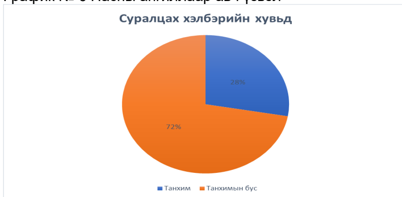
График № 7 Суралцах хэлбэрийн хувьд танхимаар 25, танхимын бус зайнаас 65 суралцагч байна.

Энэ хичээлийн жилд бага боловсролын 4-р ангид 3, 5-р ангид- 5 нийт 8 суралцагч, суурь боловсролд 6-р ангид -4, 7-р ангид -2, 8-р ангид 3, 9-р ангид 11 суралцагч, бүрэн дунд боловсрол эзэмшихээр 10- ангид 11, 11-р ангид 9, 12-ангид 42 иргэн суралцаж эхэллээ.