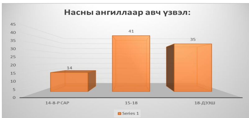
График № 6 Насны ангиллаар авч үзвэл