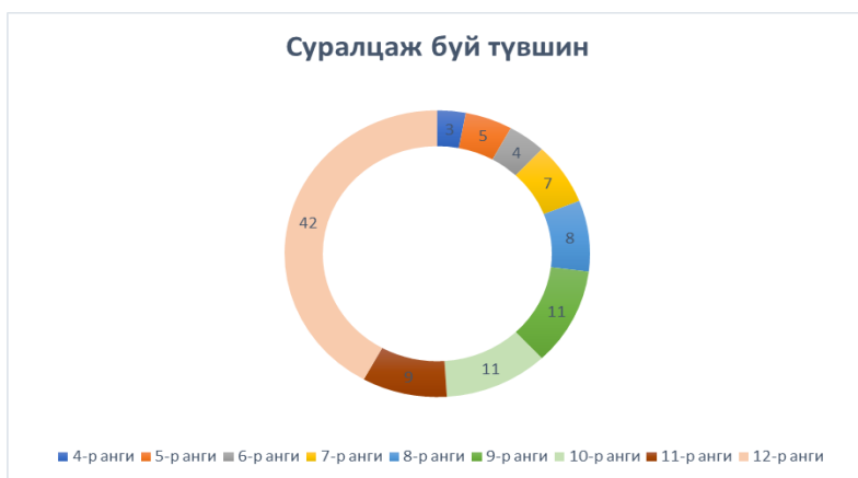
График № 8 Суралцаж буй түвшин

Энэ хичээлийн жилд бага боловсролын 4-р ангид 3, 5-р ангид- 5 нийт 8 суралцагч, суурь боловсролд 6-р ангид -4, 7-р ангид -2, 8-р ангид 3, 9-р ангид 11 суралцагч, бүрэн дунд боловсрол эзэмшихээр 10- ангид 11, 11-р ангид 9, 12-ангид 42 иргэн суралцаж эхэллээ.