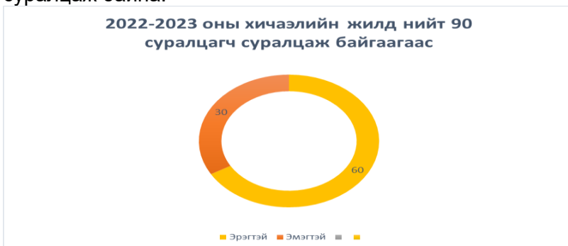
График № 5 Хүйсээр нь авч үзвэл

В. 2022-2023 оны хичээлийн жилд эрэгтэй 60, эмэгтэй 30 нийт 90 суралцагч суралцаж байна.