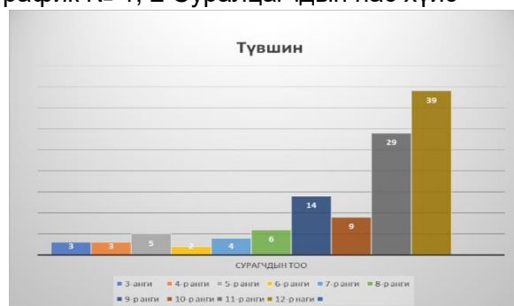
График № 3, 4 Сурагчдын ангийн тоо, боловсролын түвшин