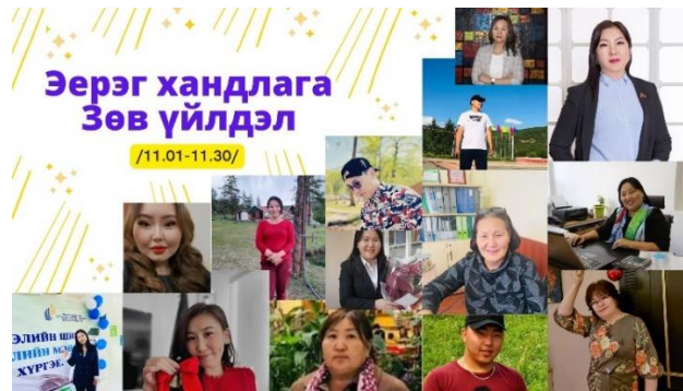
Зураг №5 “Эерэг хандлага-Зөв үйлдэл” постер

Энэхүү аяны хүрээнд өдөр бүр бие биенээ хүндэтгэж, эерэг харилцааг зарчимаа болгон зөв боловсон харилцаж нэг нэгэндээ урам хайрлах, хийж буй ажлын хүрээнд өдөр бүр зөв үйлдлүүдийг гаргах, хэвшүүлэх, хамтран ажиллаж буй хүндээ эерэг нөлөөллийг үзүүлэх зэрэг үйл ажиллагаанууд зохион байгуулагдсан.