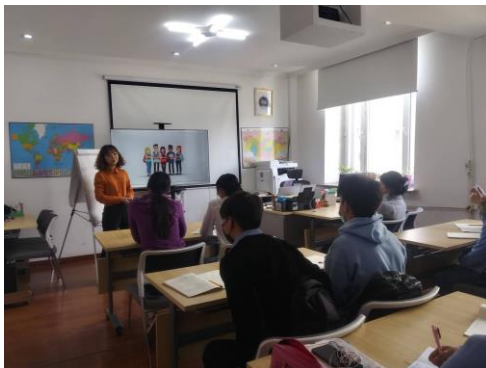
Зураг №3 Дүйцсэн хөтөлбөрийн ахлах анги

Дүйцсэн хөтөлбөрийн ахлах ангийн 11 суралцагчдад сургалт зохион байгуулсан. Сургалтаар үе тэнгийн дээрэлхэлт болон хүүхдүүдийн хоорондын харилцааны агуулгын хүрээнд сургалтаа явуулж харилцан ярилцаж, эерэг харилцаатай байхыг уриалсан.