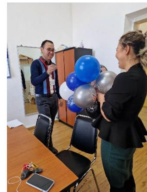
Зураг №6,7,8 “Эерэг хандлага-Зөв үйлдэл” аян