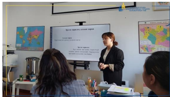
Зураг №1,2 ХУД АНБНТБТ өглөөний цай үйл ажиллагаа