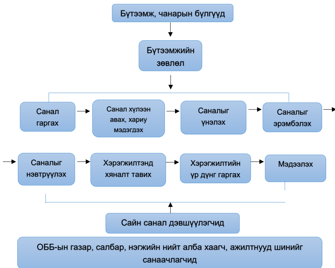
Бүдүүвч 3. “Сайн саналын систем 3С”-ийг хэрэгжүүлэх үйл ажиллагааны зохион байгуулалт

5.4.2. “Сайн саналын систем (3С)” нь аливаа үйл ажиллагааг тасралтгүй алхам алхамаар сайжруулах чиг хандлага бөгөөд байгууллагын үйл ажиллагааг сайжруулах зорилготойгоор алба хаагч, ажилтнуудаас гарах шинэлэг санаа, бодлыг нэгтгэх зорилготой хийгдэнэ. Сайн саналын систем нь аливаа асуудлыг бүх нийтээр хамтран хэлэлцэж, шийдвэрлэх арга замыг тодорхойлох үндсэн дээр байгууллагын үйл ажиллагааг сайжруулж, үр ашиг, бүтээмж чанарыг дээшлүүлэх чиглэлээр алба хаагч, ажилтнуудаас гаргаж байгаа шинэ санал санаачлагыг урамшуулан дэмжих систем юм.