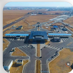
Замын-Үүд боомтын шинэчлэл 2024 он