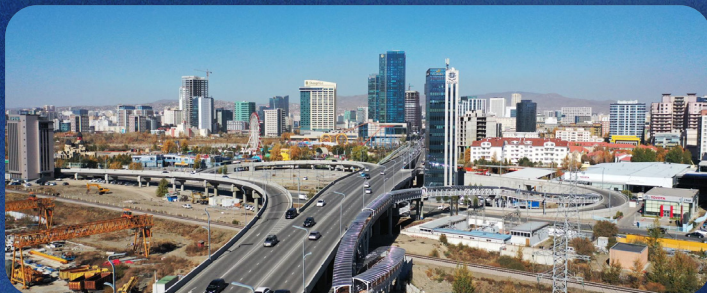
Олимпын гүүр 2020 он