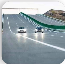
Дархан -Улаанбаатар чиглэлийн босоо тэнхлэгийн 204,6 км авто зам