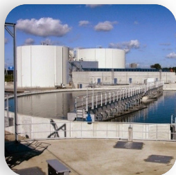
Улаанбаатар хотын төв цэвэрлэх байгууламжийг барих төсөл