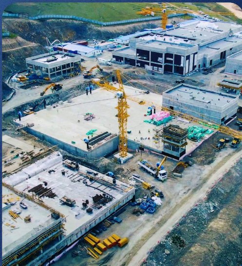
Ус гүн цэвэршүүлэх үйлдвэрийн төсөл 2024 он