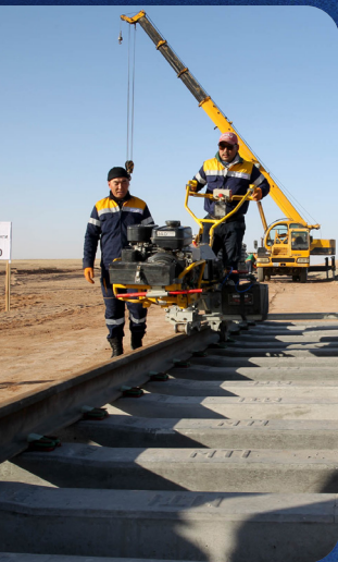
Тавантолгой- Зүүнбаян чиглэлийн төмөр зам 2021 он