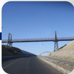
Таван толгой Ханги чиглэлийн 477км хүнд даацын авто зам барих төсөл