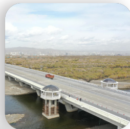
Яармагийн шинэ гүүр 2024 он