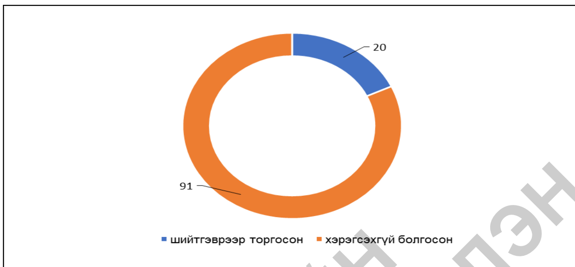
Зураг 1. Зөрчлийн тухай хууль /6.21 дүгээр зүйл. Гүтгэх/ 2017.07.01-ээс 9 , /тоон утгаар/

Дээр дурдсанчлан “гүтгэх”, “доромжлох” үйлдлийг урьд нь 2002 оны Эрүүгийн хуулийн Доромжлох буюу “Бусдын нэр төр, алдар хүндийг олон нийтийн өмнө доромжилсон” /110 дугаар зүйл/, Гүтгэх буюу “Хүний нэр төр, алдар хүндийг гутаах зорилгоор илт худал гүжирдлэг тараасан” /111 дүгээр зүйл/ гэсэн зүйлээр тус тус зохицуулж байсан. Энэхүү хүний эрх, эрх чөлөө, алдар хүнд, нэр төрийн эсрэг гэмт хэрэг буюу доромжлох, гүтгэх хэргийн тоон үзүүлэлтийг 2011-2016 оны байдлаар авч үзье. /Зураг 2-ыг үзнэ үү/.