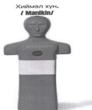
б. Хиймэл хүн