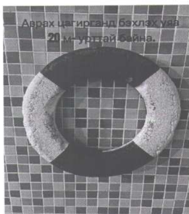
а. Аврах цагариг