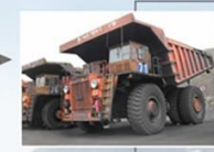
2 дахь загвар