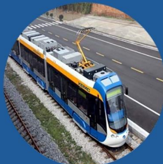
Төмөр замын тоног төхөөрөмж