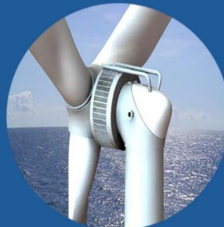
Сэргээгдэх эрчим хүчний тоног төхөөрөмж