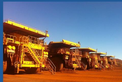
Рио тинто-н Пилбара уурхай