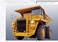
4 дэх загвар