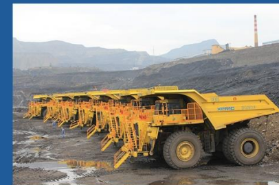
Шинхуа Нинся нүүрсний уурхай