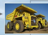
2 дахь загвар