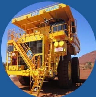
Уул уурхайн тоног төхөрөмж

XEMC нь цахилгаан дамжуулах технологийг өөрсдийн бизнесийн гол цөм болгож уул уурхай, эрчим хүч, тээвэрлэлт, усан хангамж, хими, хөнгөн үйлдвэрлэл зэрэг салбаруудад олон талын шийдлүүдийг гарган ажиллаж байна.