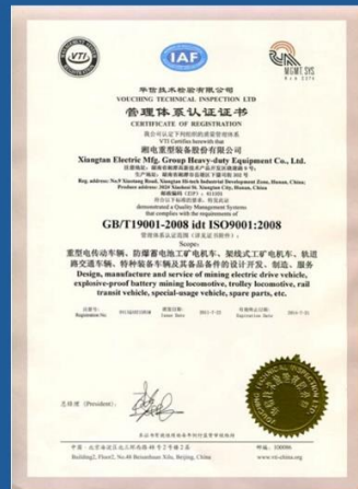
Чанарын менежментийн системийн ISO9001-2008 гэрчилгээ