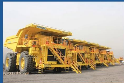
Хуанэн Иньминь нүүрсний уурхай