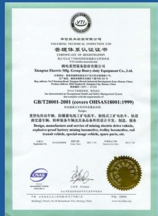
Хөдөлмөрийн эрүүл ахуй, аюулгүй байдлын менежментийн OHSAS18001-1999 гэрчилгээ