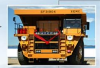
3 дахь загвар