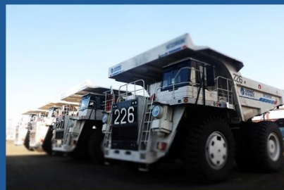
Шарын голын нүүрсний уурхай