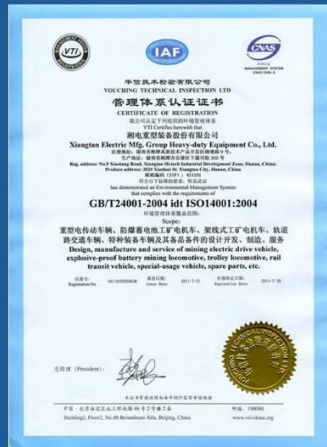
Байгаль орчны менежментийн ISO14001-2004 гэрчилгээ

Рио Тинто компанитай хамтран ажиллаж эхэлсэн цагаас олон улсын стандартын дагуу автосамосвал үйлдвэрлэж байна