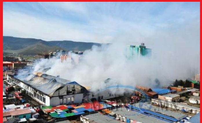
Нарантуул зах 08/23/2013

Манай улсын хэмжээнд 2017 онд ОБЕГ-ын мэдээлснээр 1237 удаагийн объектийн гал түймэр гарч, 3,6 тэрбум төгрөгийн хохирол учирч, гал түймэрт өртөн 23 хүн нас барж, 10 хүн түлэгдэж, 533 гэр орон сууц шатсан байна.