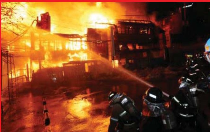
Улаанбаатар хот 2015 оны 3 сар

МАНАЙ УЛСАД ОБЪЕКТИЙН ГАЛ ТҮЙМРИЙН ЭРСДЭЛ УЛАМ БҮР ХУРЦАДСААР БАЙНА.