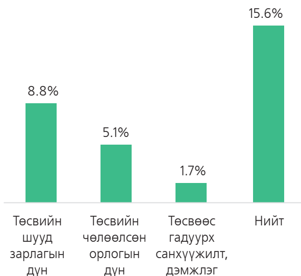
ГРАФИК 1. ТӨСВИЙН БОДЛОГЫН ХЭРЭГСЛҮҮДИЙН ДҮН, ДНБ-Д ЭЗЛЭХ ХУВЬ (2020 ОНЫ ҮНЭЭР)

2020 оны 2-р улирлаас 2021 оны 2-р улирлын хооронд Ковид-19 цар тахлын эсрэг хэрэгжүүлсэн төсвийн бодлогын арга хэмжээний нийт дүн 5.8 их наяд болж байгаа нь 2020 оны нэрлэсэн ДНБ-ий 15.6 хувьтай тэнцэж байна. Үүнийг бодлогын хэрэгслүүдээр нь салгаж авч үзэхэд, төсвийн шууд зарлага 3.3 их наяд төгрөг байгаа нь хамгийн өндөр үзүүлэлт бөгөөд энэ нь ДНБ-ий