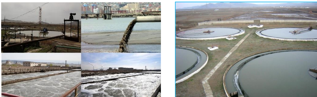
Зураг 2.2 Улаанбаатар хотын төв цэвэрлэх байгууламжийг гадаад байдал

Одоогийн байдлаар төв цэвэрлэх байгууламж нь 143 ажиллагсадтай, хоногт дунджаар 160-200 мянган ам дөрвөлжин бохир усыг хүлээн авч механик биологийн цэвэрлэгээг хийж, хлор болон хэт ягаан туяагаар халдваргүйжүүлж Туул гол руу нийлүүлж байгаа аж. Мөн бохир ус цэвэрлэгээний арга нь анх төлөвлөснөөс зарчмын хувьд өөрчлөгдөөгүй ч лаг, үлдэцийн боловсруулалт хийх метантенкийн байгууламж төлөвлөгдсөний дагуу баригдаагүйгээс тэдгээрийг боловсруулалтгүйгээр лагийн талбайд байгалийн аргаар хатааж байна. Цэвэрлэх байгууламжийн өргөтгөлөөр газар ашиглалтыг сайжруулах, лаг тунадасны хатаалтын явцыг түргэтгэх зорилгоор лагийн талбайг лаг нягтруулах талбай болгон өөрчилж барьжээ. Механик цэвэрлэгээгээр хог, өөх тос, элс, лагийг бохир уснаас цэвэрлэдэг. Биологи цэвэрлэгээгээр агаар, идэвхит лагийн тусламжтайгаар органик бохирдлыг исэлдүүлэн эрдэсжүүлж, хэт ягаан туяагаар халдваргүйжүүлэх үйл ажиллагаа явуулдаг. Нийт 14.7 га нийлбэр талбай бүхий 44 жижиг талбарт хоногт 600-700 м 3 лагийг насосоор шахаж, байгалийн аргаар хатааж, жил бүр 14-15 мянган м 3 хатсан лагийг механизмаар бөөгнүүлэн ачиж, автомашинаар зөөж тусгай талбайд хаяна.