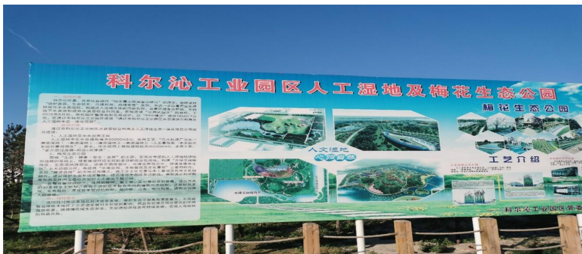
Зураг 2.1 Тонгляо хотын бохирдолтой усыг дахин боловсруулах үйлдвэрийн гадаад байдал

Энэ компани нь биологийн хиймэл бордоо, янз бүрийн хүчлүүд үйлдвэрлэн дэлхийн зах зээлд нийлүүлдэг. Үйлдвэрийн хүчин чадлын хувьд жилд 500,000 тонн MSG, янз бүрийн амин хүчлийн бүтээгдэхүүн 260,000 тонн, гар аргаар хийсэн бүтээгдэхүүн, амтлагч, биохими, тэжээл, эм, бусад олон бүтээгдэхүүнийг үйлдвэрлэх боломжтой бөгөөд борлуулалтыг хийх томхон үйлдвэрлэлийн кластерийг хөгжүүлсэн. Мөн бүтээгдэхүүнээ Ази, Африк, Европ руу экспортлож, дэлхийн томхон амин хүчил үйлдвэрлэдэг аж үйлдвэрийн нэг болж чаджээ.